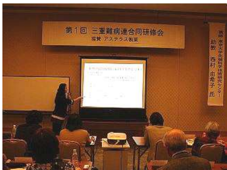
H23.4月2～3日開催 第1回三難連合同研修会の様子

三重難病連の加盟団体が集まって行う合同研修会ですが、第2回目を下記の日程・内容で開催することが決まりました。今回はファイザー製薬株式会社様にご協賛いただきました。