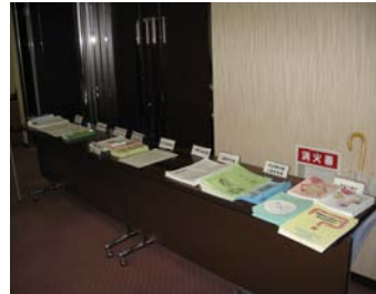
各団体さんの情報が満載