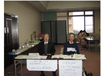
「みなさん署名をお願いします」 パーキンソンみえの方もご参加 くださいました