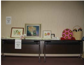
作品展示コーナー (みえIBDの会員さんが作られた作品です！)

2月26日（日）午後1時30分から午後3時まで、四日市社会保険病院内の健康管理センター4階多目的ホールにて、第4回地域難病相談会を開催しました。あいにくの雨模様でしたが、76名と多くの参加があり、充実したとても和やかな相談会となりました。